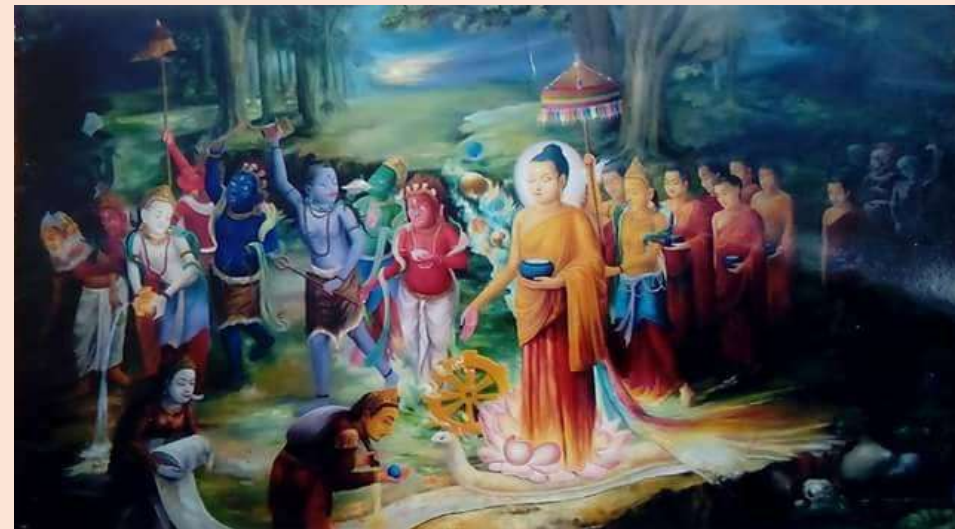
The Buddha visiting to Lumbini sacred garden, where he was born

महामानव वृद्ध व हनवदरियनिगु वृद्धिया लब्धि